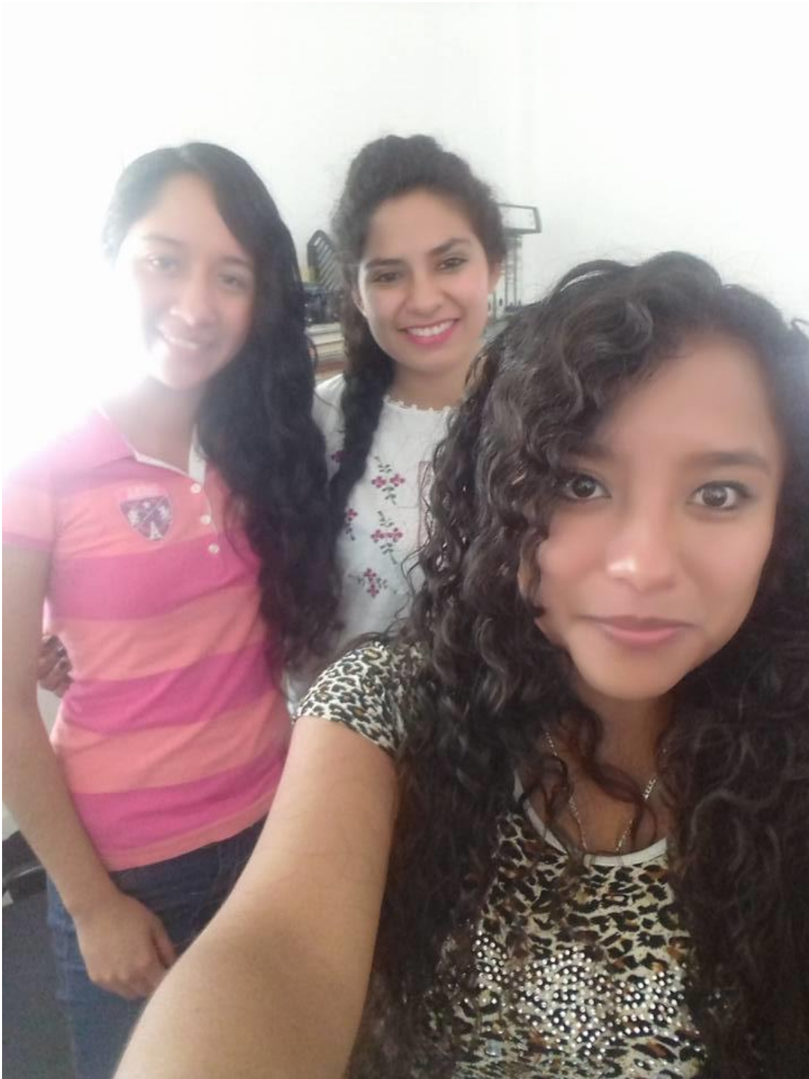
*Compañeras pasantes de la Universidad Stranford.